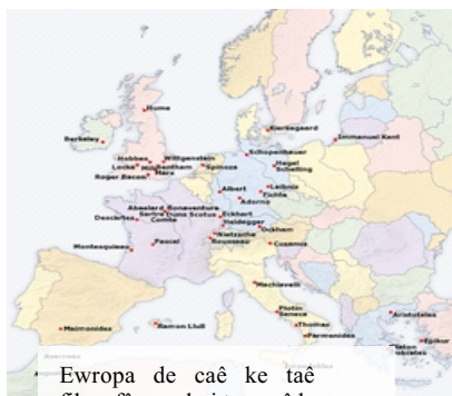
Ewropa de caê ke taê filozofê namdari tewr zêde lebetiyaê

Merhemê felsefeyê bini ki, xo dergê tertib u nızamê zanayîşê insaniê sistematiki kenê ke tede qıymet u hıquq u wezifeyanê merdumaneyan ra pia yew fikr u idey dınya salê bıvıraziyo.